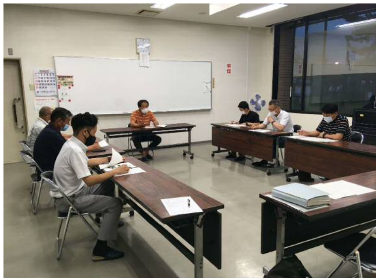
令和3年6月18日実施 総会(役員会)